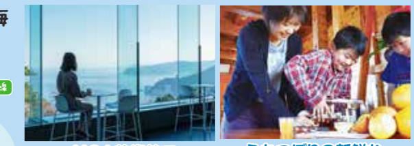
MOA美術館で癒しのひととき ふたつぼりの新鮮なオレンジで生ジュース絞り