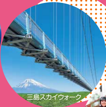
三島スカイウォーク