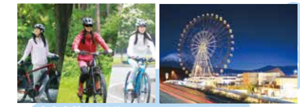
富士山麓をE-bikeで楽しもう 道の駅「富士川楽座」の大観覧車「Fuji Sky View」