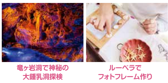
竜ヶ岩洞で神秘的な大鍾乳洞探検 ルーペラでフォトフレーム作り