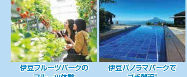
伊豆フルーツパークのフルーツ体験 伊豆パノラマパークでプチ贅沢!