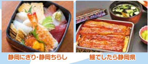
静岡にぎり・静岡ちらし 鰻でしたら静岡県