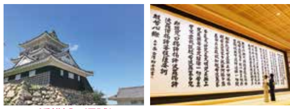
浜松城で運試し 龍雲寺の世界一大きい般若心経