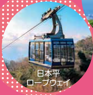
日本平 ロープウェイ