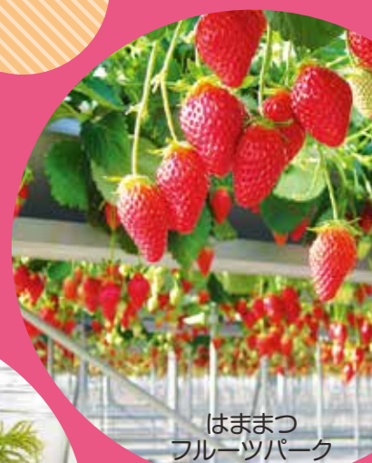
はまつ フルーツパーク