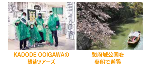
KADOE OOIOWAの緑茶ツアー 駿府城公園を英船で遊覧