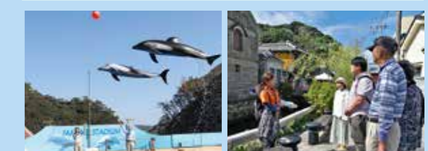
イルカが近い! 下田海中水族館 下田の陸・海ジオツアー